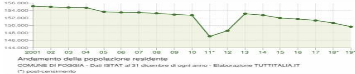
Grafici sulla popolazione residente

Un giorno tra sondaggi, indagini e grafici nazionali, ci siamo chiesti con curiosità: "C'e' anche la nostra città?" Si che c'è: